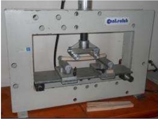
Fig. 3. Kampioni, pajisjet dhe makina e provave