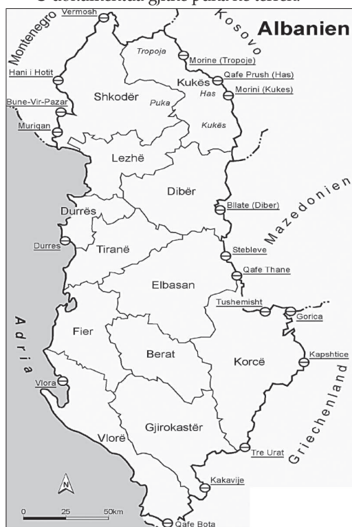
Harta e zonave kufitare të Shqipërisë me vendet fqinjë